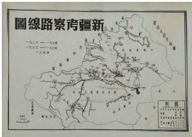
图1 新疆考察路线图

20世纪20—30年代，中国与瑞典合作开展了一次历时6年的大规模、综合性西北科学考察活动，覆盖内蒙古、甘肃、新疆、宁夏、青海等地（图1），内容涉及地质、古生物、考古、气象、地理、水文、历史、文化和民俗等。这次科考活动的目的之一，是为德国航空公司开辟欧洲至新疆的欧亚航线进行气象、地质考察，因此，科考团在新疆的气象科考活动是史无前例的。气象科考在德国气象专家赫德博士的领导下，除在内蒙古建立了一个气象观测站之外，在南疆、北疆、东疆建立了10个气象站（包括山区气象站），开展了年度以上的持续观测，观测项目多、观测内容全、使用的气象仪器先进，获取了大量的第一手气象观测资料（图2、图3），为分析新疆大范围的天气气候特点奠定了坚实的基础，并为新疆乃至全国开展气象活动培养了人才。