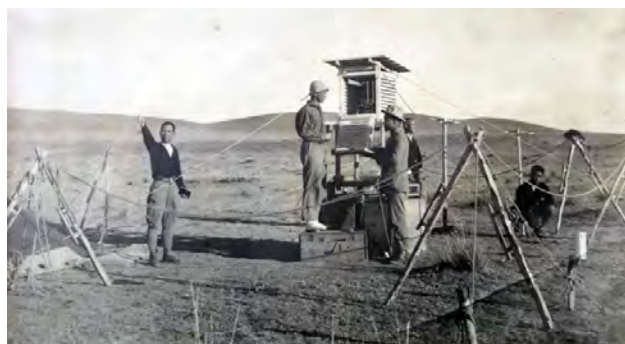
图2 考察期间设立的临时气象站