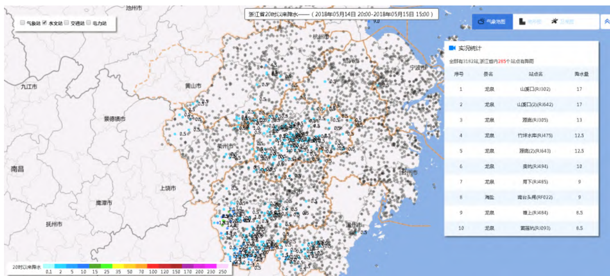
图3 浙江气象决策服务云平台中行业间数据的实时显示

参照行业共享数据的标准化业务流程,将行业数据进行相应的规范化处理,实现了行业共享数据的标准化管理,并建设了存储行业共享数据的存储数据库,通过接口调用,实现行业间共享数据的实时访问。如图3为“浙江气象决策服务云平台”中接入的水文、交通、电力站数据的实时数据。从图3中可以看出,通过数据接口获取行业间的气象数据,实现了各类部门间资料与本部门数据的一张图显示,体现了多源信息在气象中的融合,保障了行业间数据的应用。