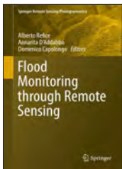
Flood Monitoring through Remote Sense 《利用遥感进行洪水监测》

编著者：Alberto Refice 等 出版者：Springer 出版年：2018