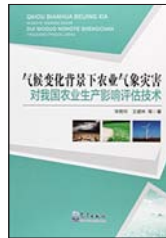
《气候变化背景下农业气象灾害对我国农业生产影响评估技术》

编著者: 威尔·布鲁萨著; 王忠静等译 出版者: 气象出版社 出版年: 2017