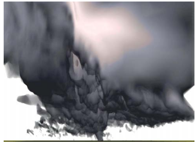
图3 水平分辨率为 25\text{ m} \times 25\text{ m} 的ARPS模式所模拟的凝结云三维图像

对流尺度数值模式对龙卷的模拟能力近年也有长足的进步。图3是美国俄克拉荷马大学薛明教授领导的团队用水平分辨率为 25\text{ m} \times 25\text{ m} 的ARPS (Advanced Regional Prediction System) 模式所模拟的凝结云的三维图像, 云底的超级龙卷清晰可见。