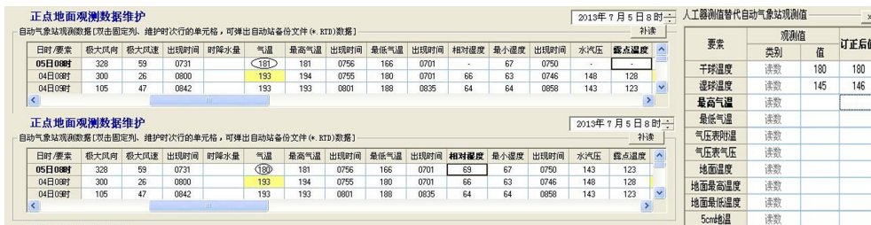
图4 张北7月5日08时地面观测数据正点维护截图

都不能获取时，用前、后两定时数据内插求得（风、降水量除外）。并按正常数据统计，若连续两个或以上定时数据缺测时，不能内插，仍按缺测处理。最后做一般性备注。